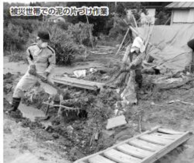
被災世帯での泥の片づけ作業