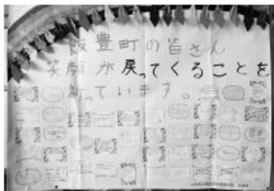
県立鶴岡高等養護学校の生徒会よりあたたかいメッセージが寄せられました