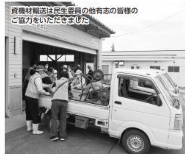
資機材輸送は民生委員の他有志の皆様のご協力をいただきました