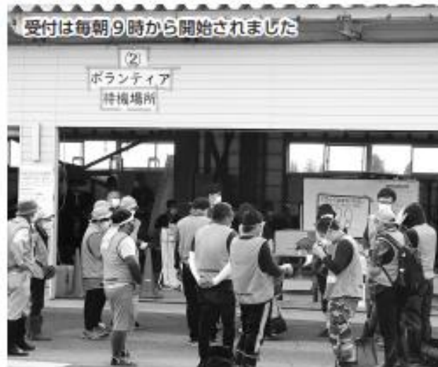
受付は毎朝9時から開始されました