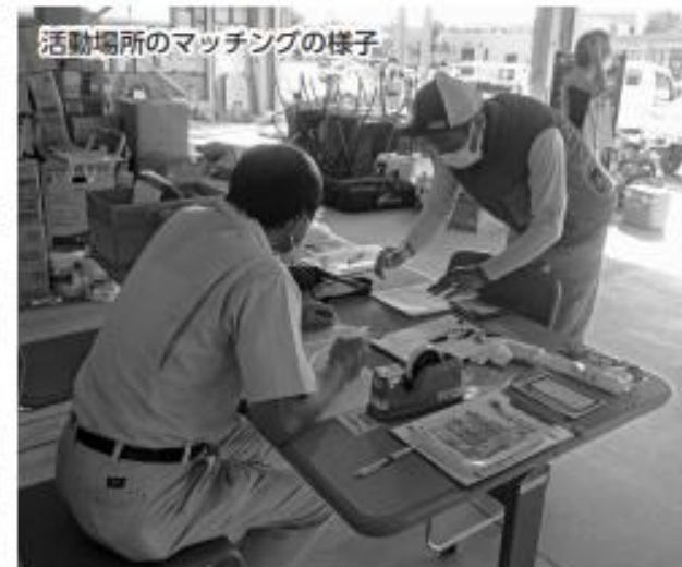
活動場所のマッチングの様子