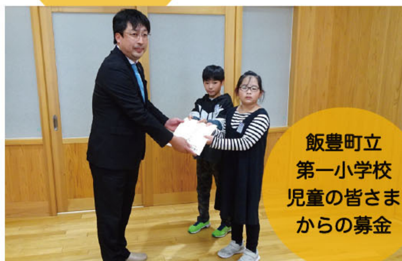
飯豊町立 第一小学校 児童の皆さま からの募金