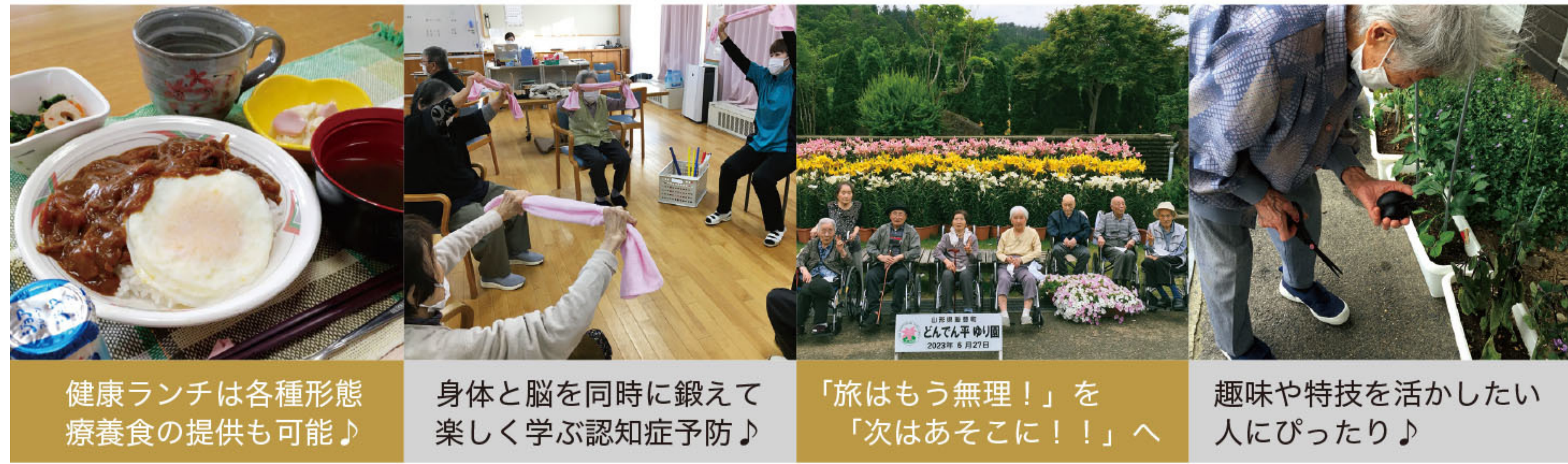
健康ランチは各種形態療養食の提供も可能♪