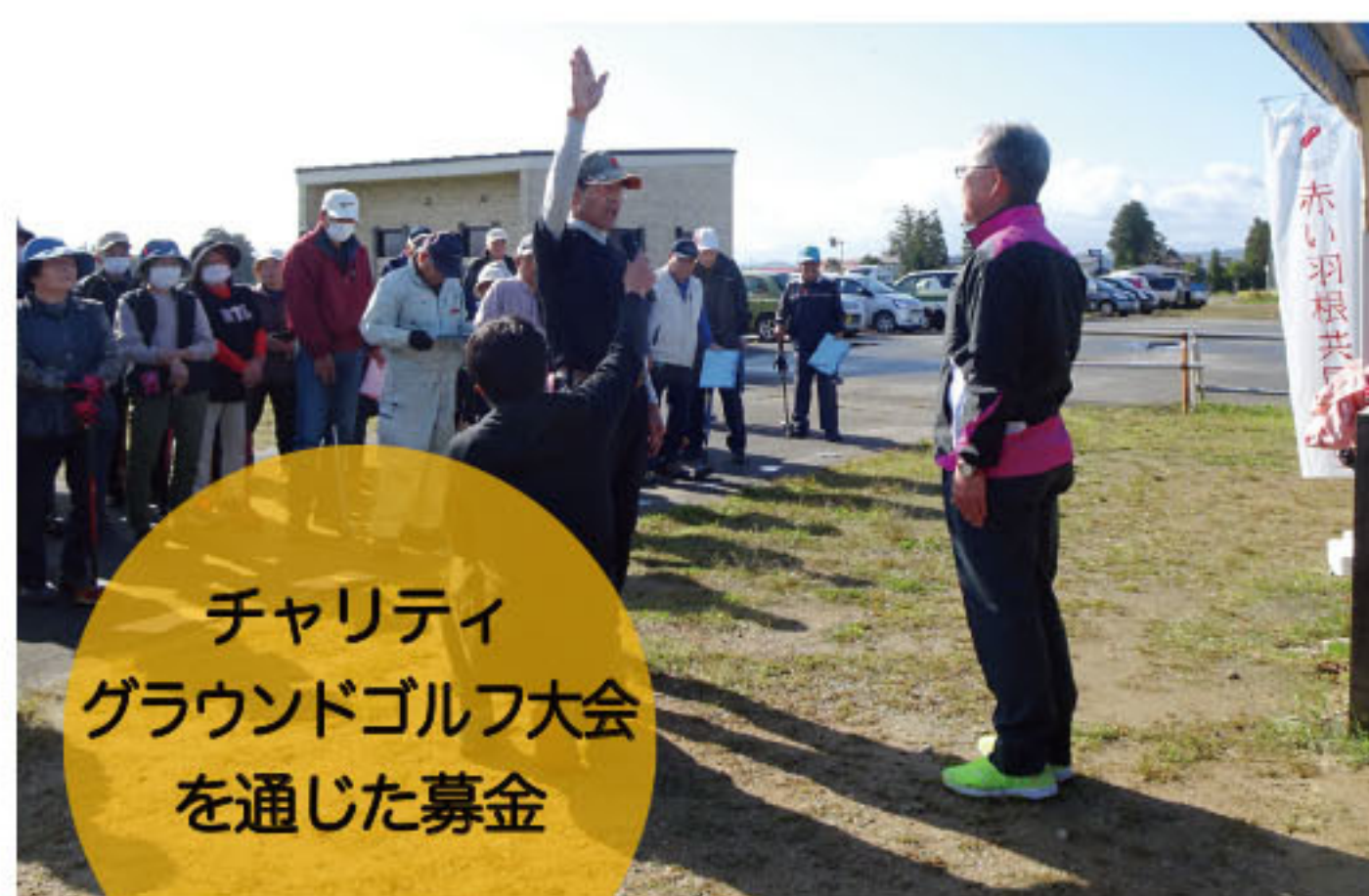
チャリティ グラウンドゴルフ大会 を通じた募金