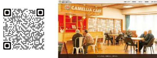
▲ 福祉の里めざみのホームページとQRコード