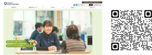
▲ 飯豊町社会福祉協議会のホームページとQRコード

また、スマートフォンやタブレットでの表示に対応し、デバイスを問わずにいつでもご覧いただけるようになりました。