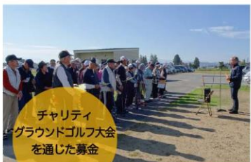
チャリティ グラウンドゴルフ大会 を通じた募金