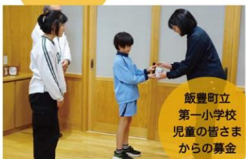
飯豊町立 第一小学校 児童の皆さま からの募金