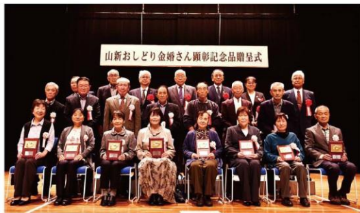
山新おしどり金婚さん顕彰記念品贈呈式

団体3種目による地区対抗戦の結果、高峰高砂会が5大会ぶりの総合優勝を獲得しました。公式ワナゲでは、最多得点者2人による決勝戦が行われ、闘志みなぎる熱投に250人の参加者が釘付けになりました。