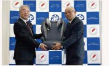
飯豊町身体障がい者福祉協会様から ジュニアシートの贈呈